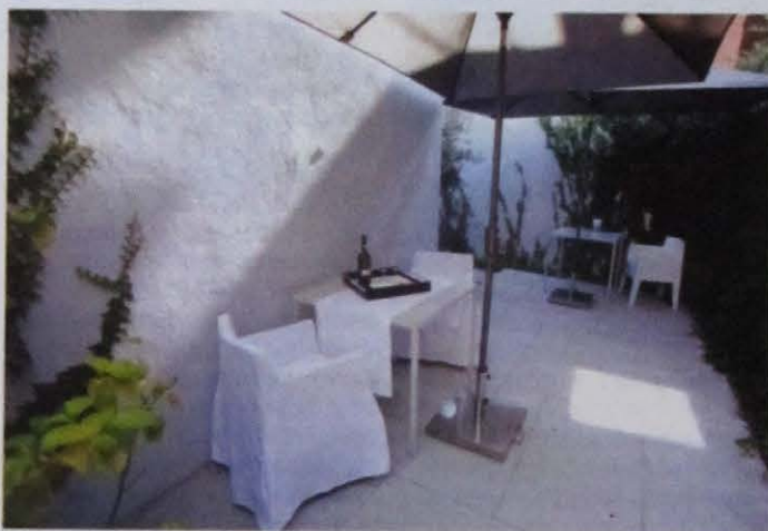
Simplicidade sofisticada Nesta casa as comodidades são dado adquirido

faz parte do serviço o convite a que se passeie e se desfrute da cidade, o que pode incluir uma visita ao Museu de Serralves, uma ida ao health club ou até o golfe. Tudo conforme as preferências dos hóspedes. Se achar que não encaixa nos três programas propostos ("Experiência Gastronómica", "Escapadela Romântica" e "Executivo"), a gerência está disposta a elaborar um programa mais à medida, para que nada falte aos hóspedes que ali cheguem de férias ou numa vinda ao Porto em trabalho.