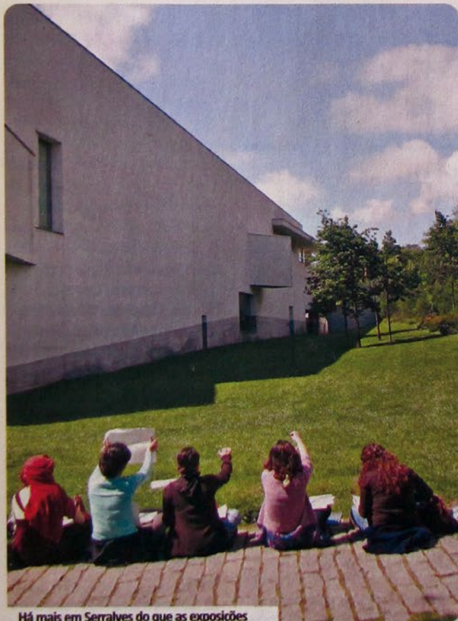
Há mais em Serralves do que as exposições

● Museu de Serralves R. Dom João de Castro, 210, Porto Tel. 808 200 543 Horário 3ª a 6ª 10h-17h; sáb., dom. e feriados 10h-19h